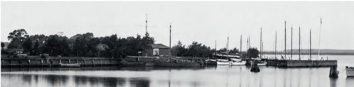
Panorama des BSV-Ufers im Westbecken. Die Aufnahme muss nach der Einweihung des Flaggenmastes (14. August 1932) entstanden sein, denn dieser ist deutlich zu erkennen.

Die Barther Segler nahmen regelmäßig an den Regatten der Nachbarvereine im DSB (Ribnitz, Stralsund, Greifswald) teil und luden diese zu den eigenen Wettfahrten ein.