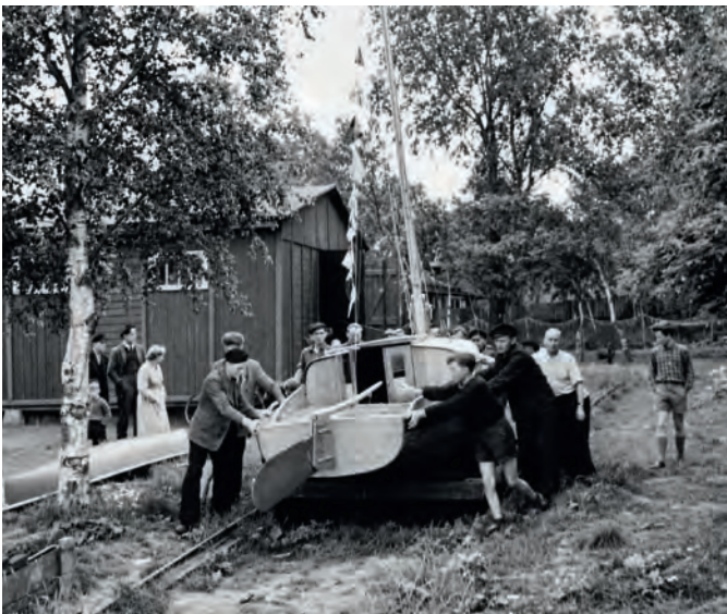
Mit vereinten Kräften wird der Jollenkruiser auf der alten Schienenslip in den Bodden geschoben.