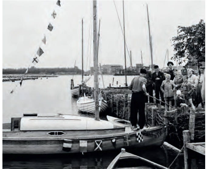
Der mit Signalflaggen geschmückte neue 15er Jollenkruiser schwimmt und wird bewundert.