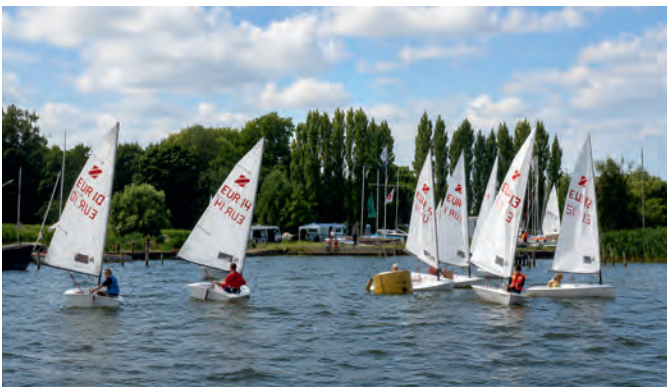
2002 kamen erstmalig Zoom8 zum Testen nach Barth.

Nach 2000 verstarben viele langjährige, engagierte und vor allem einheimische Vereinsmitglieder, die oft schon in den ersten Jahren des Neubeginns in der Sektion Segeln der BSG Motor dabei gewesen waren. Mit ihnen verlor der BSV einen Teil seines lebenswerten Charakters, der durch Neuzugänge von auswärts nicht ersetzt werden kann. In der späteren digitalen BSV-Chronik soll an diese Originale und ihre Eigenheiten erinnert werden.