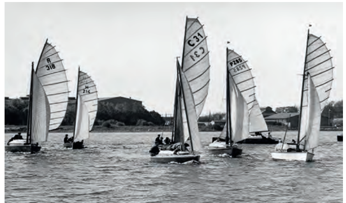
Die 20er Jollenkreuzer kurz nach ihrem Start bei Paradedewetter am Sonntag, dem 3. Juli 1955.

Schon im Winter begannen sie mit der Herrichtung des Clubgebäudes, des Steges und des Geländes für die erwarteten Gäste.