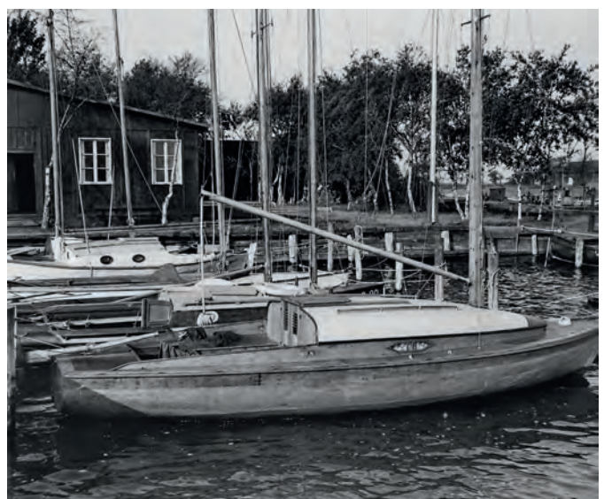
Der Neuzugang ist an seinem zukünftigen Liegeplatz eingetroffen und festgemacht.