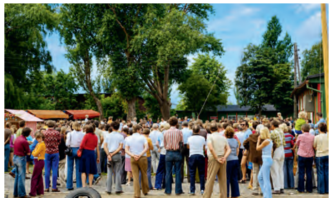
Größer konnte der Unterschied nicht ausfallen. Eröffnung des Treffens 1972 bei strömendem Regen und Wind sowie die gleiche Zeremonie vier Jahre später unter warmer Sommersonne.