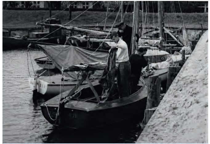
Ansegeln 1944 nach Zingst.