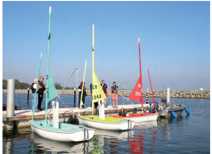
Die drei farbenfrohen Kieljollen „Hansa 303“ warten 2020 am neuen Betonsteg des BSV auf das Ablegen.

Die Anschaffung des benötigten Materials für die Projektdurchführung wurde durch die EU gefördert und beinhaltete einen geräumigen Betonsteg, drei kentersichere Kielboote des Typs „Hansa 303“, ein Sicherungsfahrzeug (Schlauchboot mit AB) sowie