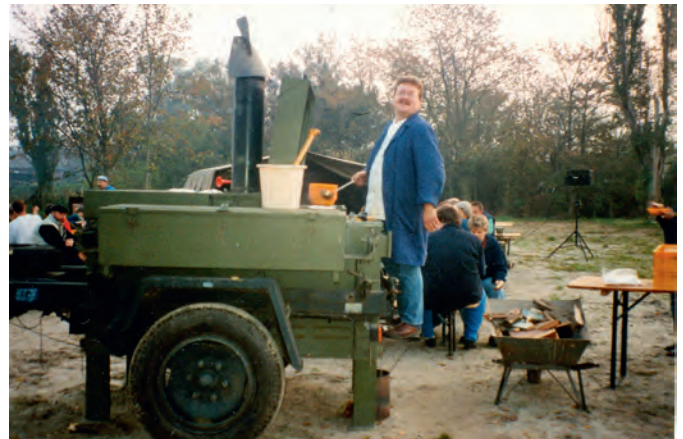
Nach dem Absegeln 1994 hatte Moppi für seine Sportfreunde einen kräftigen Kesselgulasch zubereitet.

2004 drohte aufgrund der mangelhaften Bausubstanz der Entzug der Betriebserlaubnis für die Gaststätte. Beim Ersatz der früheren Holzbaracke durch den Massivbau 20 Jahre zuvor hatte man nämlich den alten Dachstuhl und Teile des Unterbaus original belassen. 2004/2005 bauten die Segler sowie die zeitweilig auf dem Gelände beheimateten Drachen-