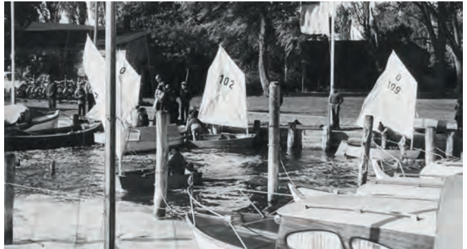
Die Optis wurden zu ihrem Schutz über alte Matratzen in das Wasser geschoben. Sliprollis gab es nicht.

Bei den Booten handelte es sich um die Opti's Flax,