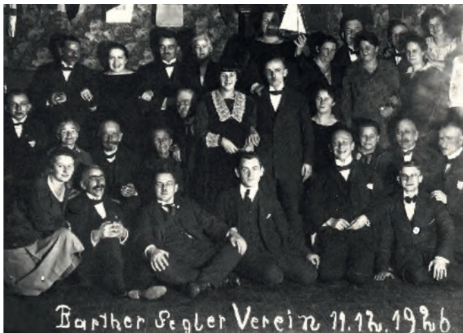
Zum Jahresende 1926 feierten die 30 Mitglieder des BSV im Hotel „Seeblick“ ihr erstes Vereinsvergnügen.

Bis zum Jahresende waren aus den sechs Gründungsmitgliedern mit zwei Segelyachten und einem Motorboot schon 30 Mitglieder mit acht Segel- und drei Motorbooten geworden.