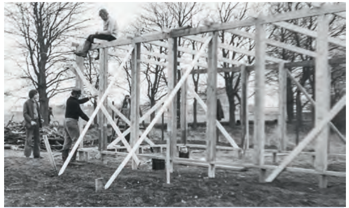
Bau der ersten Baracke im März 1975

In den Jahren zwischen 1976 und 1980 wurden zahlreiche neue, für Regatten geeignete Boote angeschafft und auch die ersten Erfolge stellten sich ein. Nach Klärung der Transportgelegenheiten fuhren die Bar-