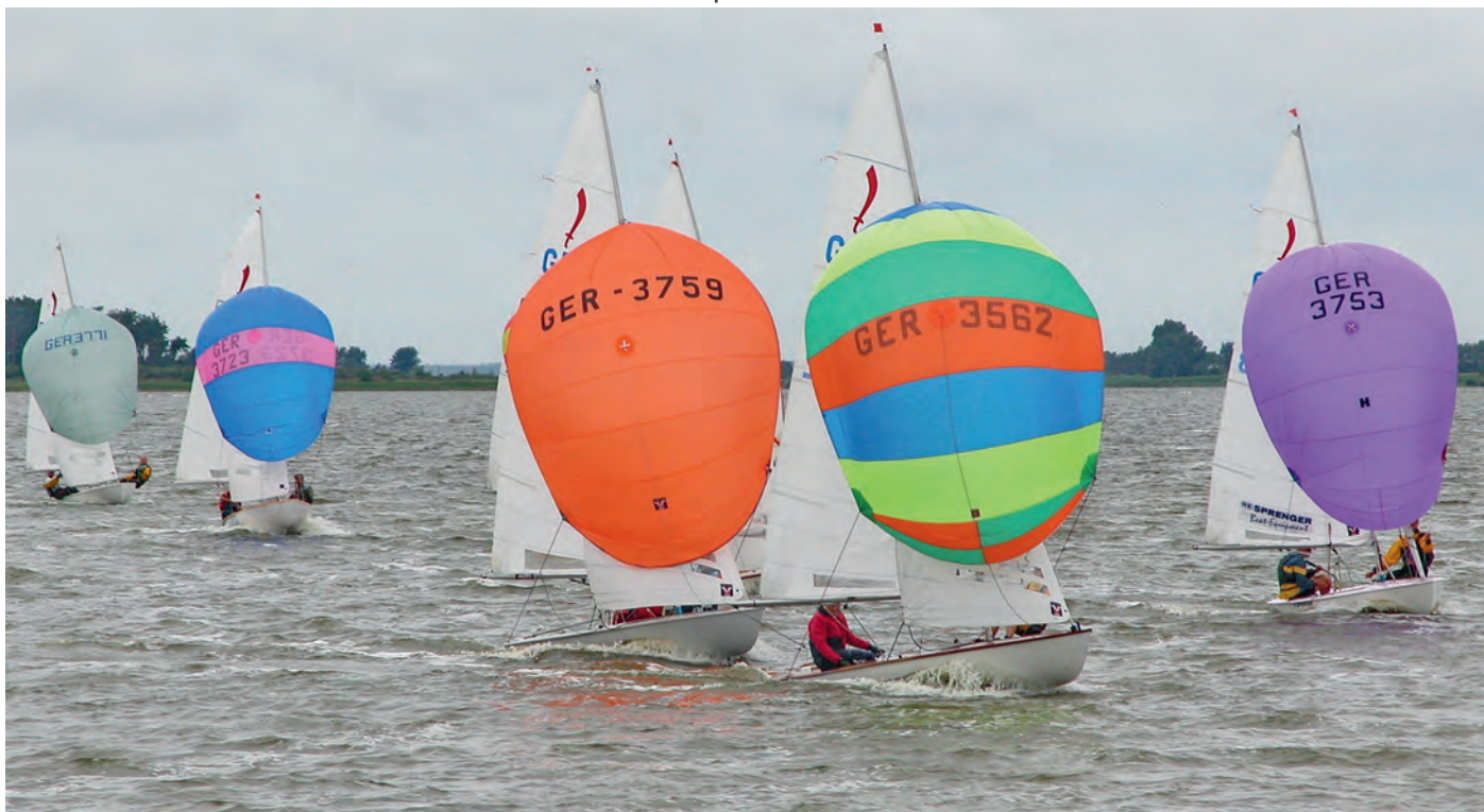
Sofort im Anschluss an die WM der Zoom8 im Juli 2005 segelten 70 Jollen der Bootsklasse Korsar bei der Internationalen Deutschen Meisterschaft (IDM) auf dem Barther Bodden um ihre Titel.

damals Leiter des DSV-Wettsegelausschusses und Geschäftsführer des Hamburger Segel-Clubs. Deutsche-, Internationale-, Jugend- und Jüngstenmeisterschaften sowie Ranglistenregatten erforderten den tagelangen Einsatz von Helfern aus mehreren Vereinen.