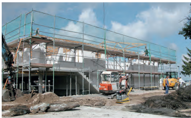
Im Frühjahr 2007 stand der Rohbau des Jugend- und Freizeitzentrums auf seinen Betonpfählen.