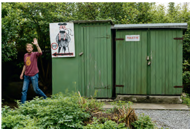
Toiletten waren stets rar. Bis Ende 1989 konnten die Segler nur dieses Doppelörtchen nutzen.