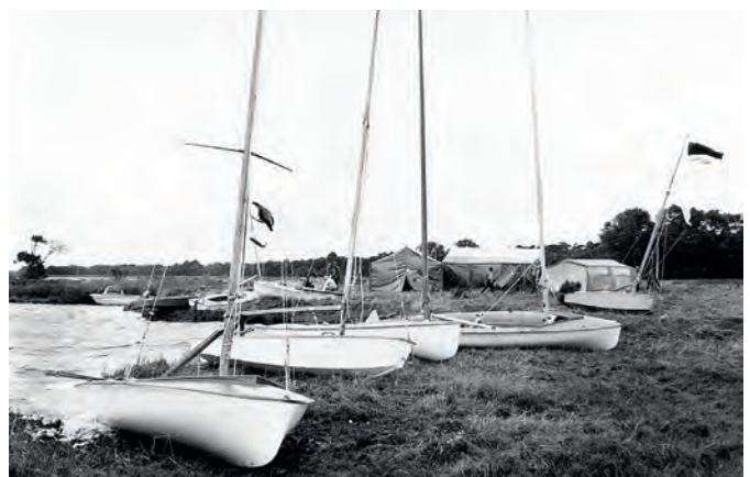
Erstes Trainingslager an der Ablage der Sundischen Wiese Mitte August 1981. Es war kalt, windig und nass.