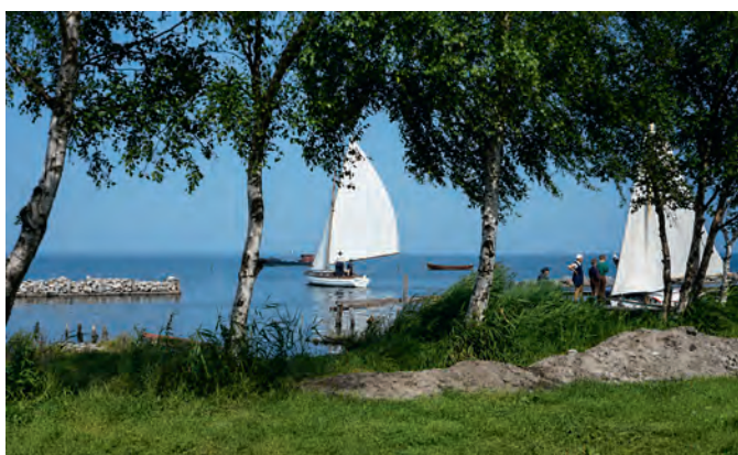
Bis weit in die 1970er Jahre hinein konnte eine Lücke in der alten Mole zum Ein- und Auslaufen genutzt werden. Die am heutigen Westteil des Nordufers beheimateten Fischer verschlossen sie zum Schutz ihrer Boote vor Wellenschlag mit Betonbruch.