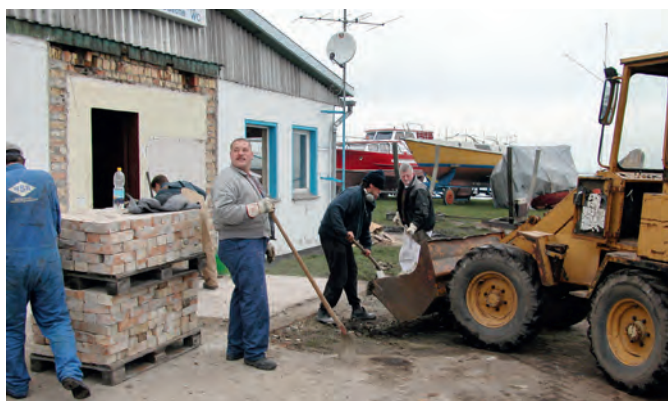
Umbau des Clubhauses 2004/05: Die abgetragenen Ziegel wurden geputzt und wiederverwendet.