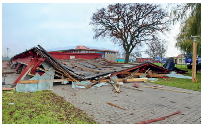
Mit der Unterstützung des THW wurde 2014 der über 100 Jahre alte Schipperschuppen abgerissen.