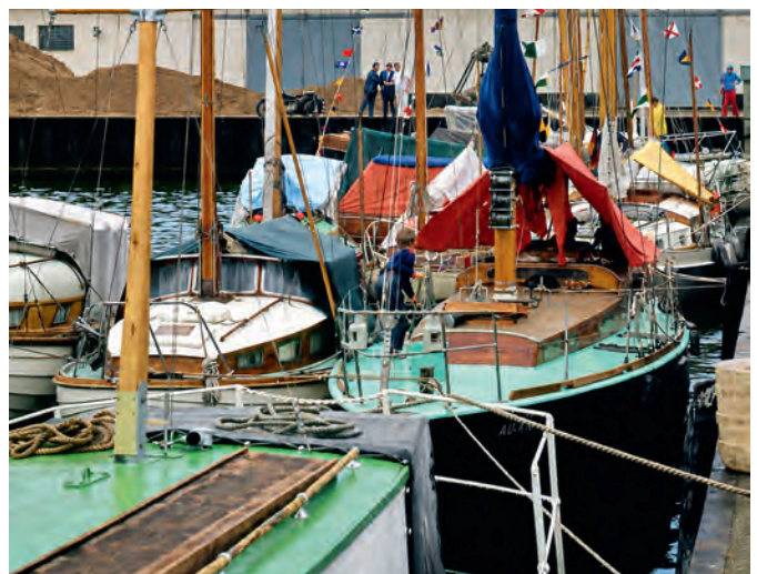
Gastboote 1972 an der Ballastkiste im Ostbecken.

Es bleibt zu erwähnen, dass den Barther Seglern die während der ersten Veranstaltung gewonnenen Erfahrungen eine sichere Routine für die nachfolgenden Fahrtenseglertreffen lieferten, deren Abläufe stets weiter perfektioniert wurden. So stellten ab 1976 die Kinder und Jugendlichen vom Borgwall morgens mit Ruderbooten den wasserseitigen Brötchenservice an den Gastbooten sicher. Für die zunehmenden Teilnehmerzahlen kamen weitere abendliche Veranstaltungsorte hinzu. Der Barther Knüller war jedoch jedes Mal der Verkauf rarer Südfrüchte. Organisiert wurde die Bückware durch Vereinsfrauen, die bei der HO tätig waren. Beispielsweise wechselten 1985 über 1300 vorgepackte Kilotüten mit Pfirsichen vom Lager des Clubhauses in die Einkaufsbeutel der Wassersportler und Schaulustigen.