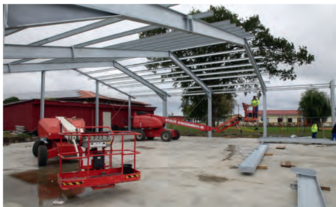
2016 konnte Dank einer Förderung des Landessportbundes eine neue Bootshalle errichtet werden.