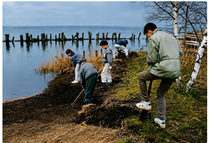
Nach dem Umzug vom Borgwall zum Verein 1991 wird die alte Fischerslip wieder benutzbar gemacht

Mitte der 1990er Jahre wurde beim BSV die personelle Absicherung des Trainings aus beruflichen Gründen immer schwieriger. Einige ältere Kuttersegler der früheren Seesportgruppe sprangen zwar gele-