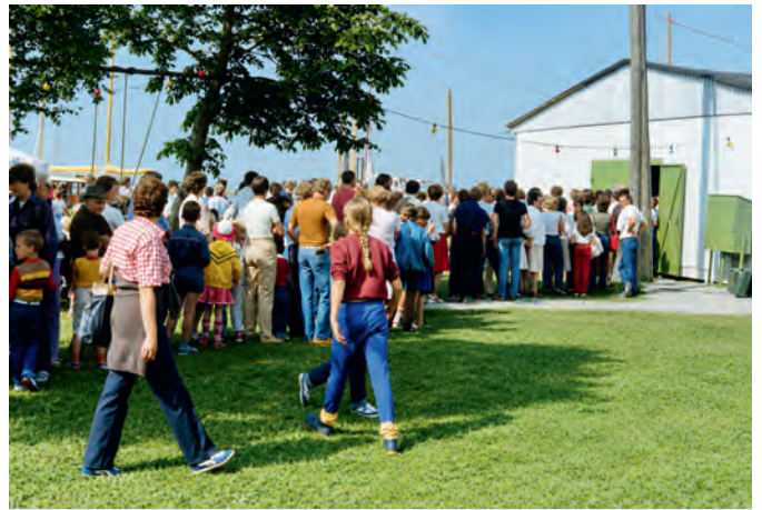
Eine lange Warteschlange stand 1985 vor dem Lagerraum an, um eine Tüte knapper Pfirsiche zu ergattern.