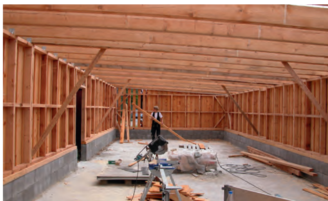
Der von einer Barther Zimmerei gefertigte Ersatz für den GST-Schuppen wurde 2007 fertiggestellt.