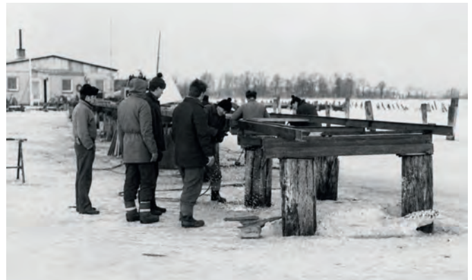
1986 wurde gewartet, bis die Eisdecke stark genug war, um am Steg zu arbeiten oder Pfähle einzuspülen.

Während Abrissarbeiten gewöhnlich mit eigenen Mitteln erfolgten, wurden Neubauten bei Notwendigkeit an Firmen vergeben, wie zum Beispiel 2006 der Ersatz für den früheren GST-Schuppen sowie der Neubau des zu 90 Prozent von der „Euroregion Pomerania“ geförderten Jugend- und Freizeitzentrums, das komplett ausgeschrieben wurde. An den Baukosten in Höhe von einer Million Euro musste sich der BSV mit 100 Tausend Euro Eigenmitteln beteiligen. Ebenso erhielt 2016 eine Hallenbaufirma den Auftrag