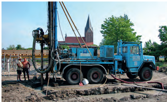
Ein Spezialunternehmen brachte die über 60 Meter tiefen Bohrlöcher für die Wärmepumpe nieder.