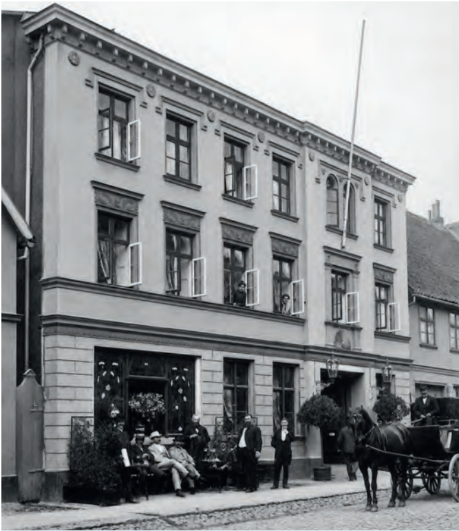
Gründungsort des BSV war das Hotel „Zur Sonne“