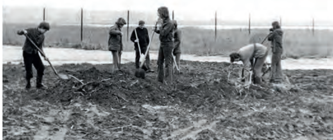
Anfang 1975 wurde täglich an der Herrichtung des Jugendgeländes am Borgwall gearbeitet.

Einen Aufschwung gab es erst wieder, als 1981