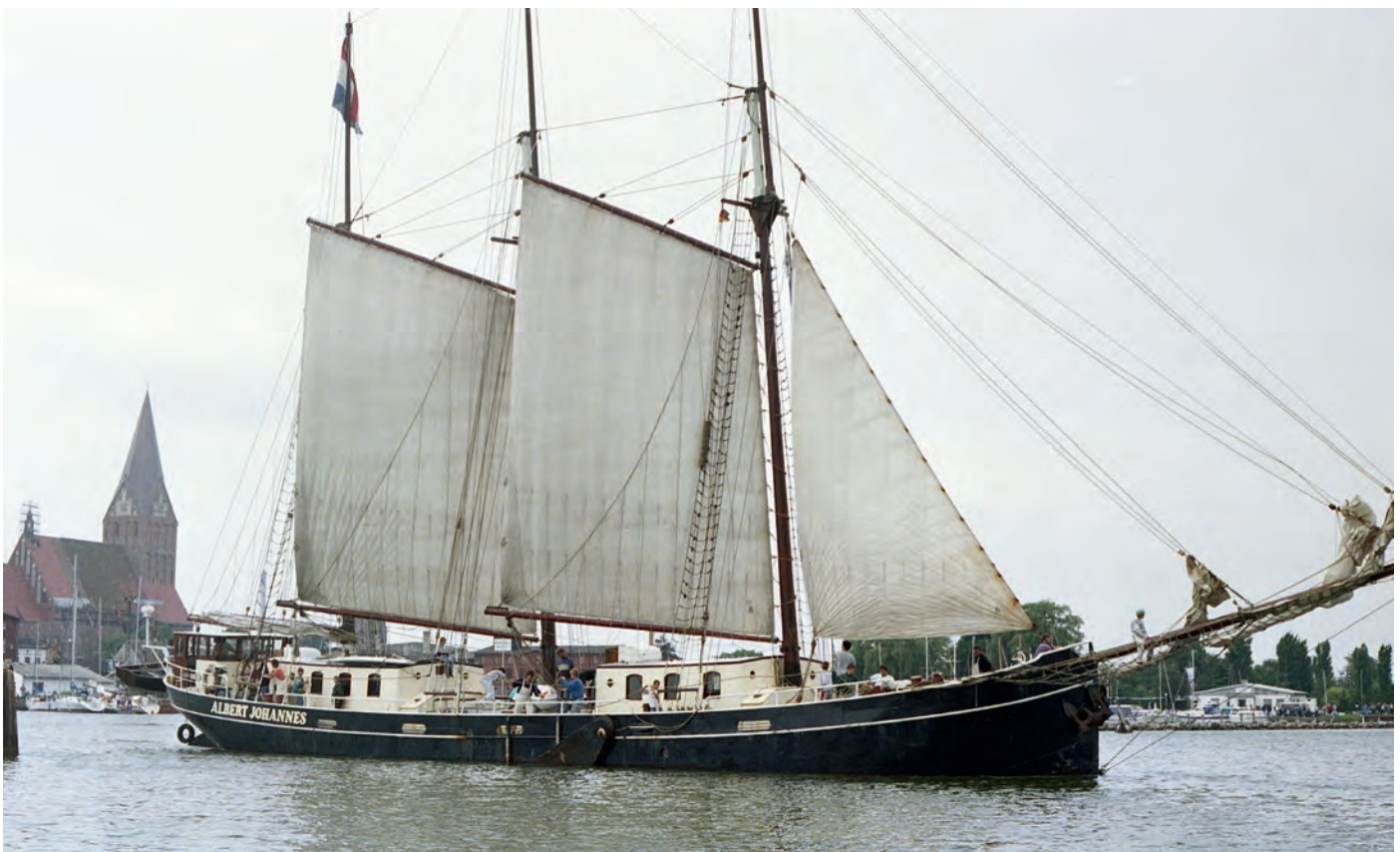
Im Juli 1993 war die Jugendgruppe für fünf Tage mit dem holländischen Dreimastschoner „Albert Johannes“ unterwegs. Das erste größere Segelschiff im Barther Hafen nach 1945 sorgte damals für Aufsehen in der Stadt. An der Reise durften auch zwei Jugendliche vom Partnerclub „Avia Prag“ teilnehmen.

Später bildeten SVBB und BSV eine Regattagemeinschaft, um sich bei der Ausrichtung von Regatten und Trainingslagern gegenseitig zu unterstützen. Bald pflegten auch die Borgwallkinder gute Kontakte zu den Prager Seglern und nahmen an den gemeinsamen