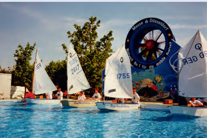
Am 24. Juli 1994 segelten Kinder der BSV-Jugendgruppe mit ihren Opti's im ZDF-Fernsehgarten in Mainz. Es war eine Werbeaktion für die 1. Segel- und Hafentage.