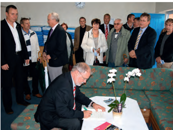
Nach der Einweihung des JFZ trägt sich Ministerpräsident Harald Ringstorff in das Gästebuch ein.