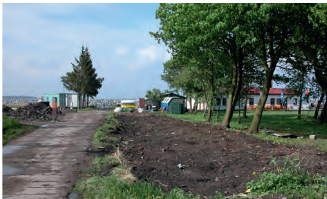
2006 wurde der alte GST-Schuppen - Teil einer einstigen Baracke des Stalag-Luft 1 - komplett abgerissen.