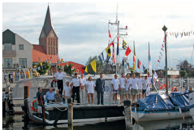
Die Kolberger Gäste mit Barther Freunden auf der Motorbarkasse des Marinetechnikums.