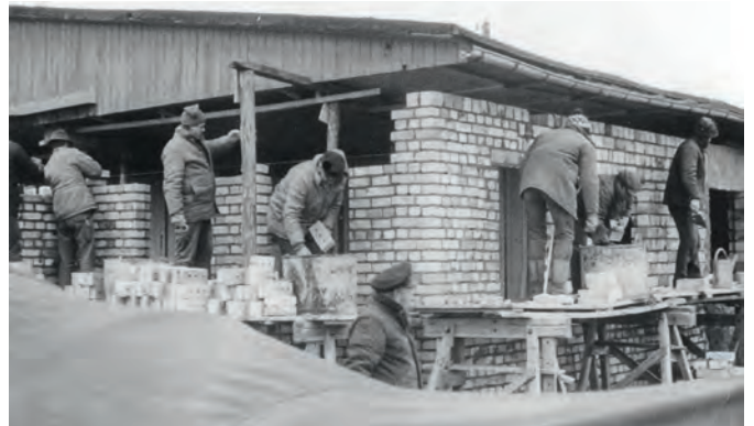
Am 20./21. Oktober 1984 wurde der hintere Teil des Clubhauses gemauert. Siegfried Stenzel und Rolf Kageel bereiteten auf der „Sus-Ann“ Grog mit 12 kleinen Flaschen Goldbrand für die Beteiligten zu.

Im Winter wurde der Clubraum mit Getöse durch einen 380-Volt-Industrielüfter beheizt, sodass man sich sehr laut unterhalten musste. Damit es schneller