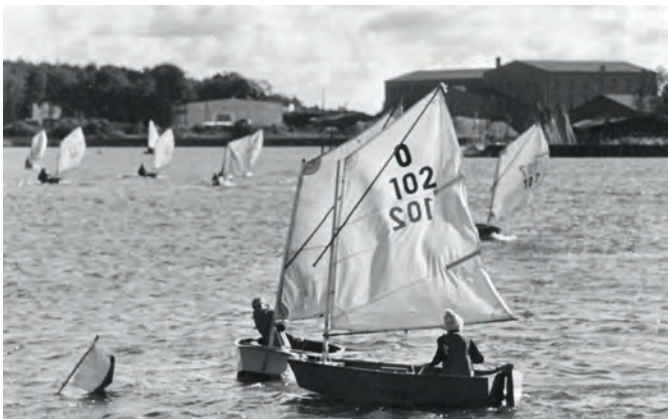
Ende April 1973 wurde eine Optiregatta im Hafen gese-gelt. Beteiligt waren die Kinder von Motor und Lok.

Ab Frühjahr 1974 kam als Trainerboot eine genietete, uralte Stahlbarkasse von ca. 4,50 Meter Länge mit luftgekühltem Dieselmotor hinzu. Dieses Vehi-kel war meist in eine dicke Abgaswolke gehüllt und machte dabei so höllischen Lärm, dass niemand mehr die Anweisungen des Trainers verstand. Die Kinder taufte das heftig qualmende und ohrenbetäubende Ungetüm schnell auf den Namen „Pittiplatsch“, der bisher noch fehlte.