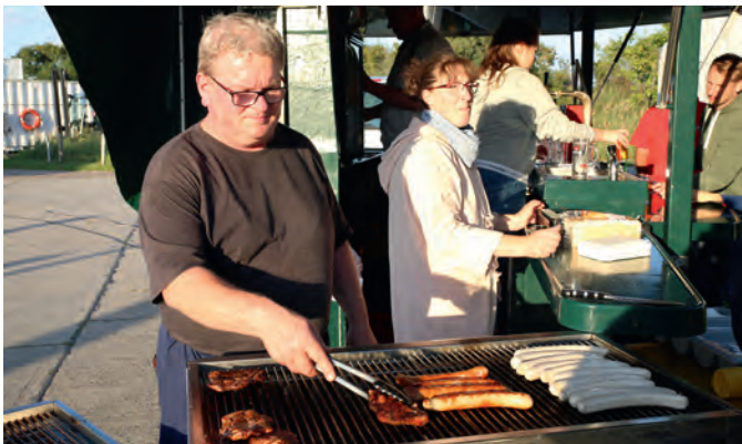
Familie Schottenhammel versorgte die Teilnehmer der Plantagenet-Regatta mit Gegrilltem und Getränken.

Rechtzeitig zur Weltmeisterschaft der Jugendbootsklasse Zoom8 im Juli 2005 war alles fertig.