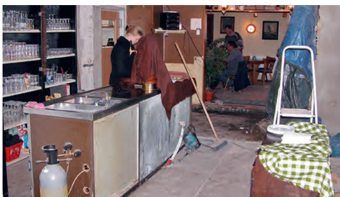
Dank geschickter Planung wurde abschnittsweise gebaut. Der Gaststättenbetrieb musste nicht ruhen.