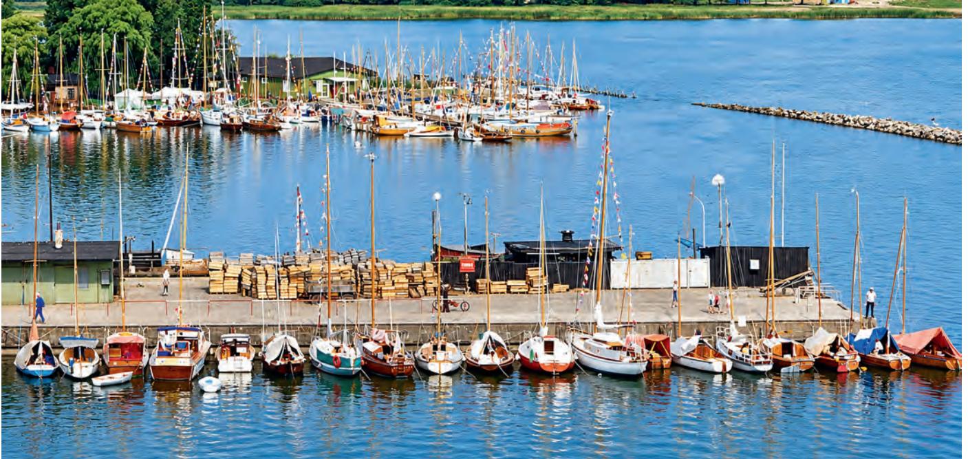
Fahrtenseglertreffen 1976: Blick über die Ballastkiste mit alter Fischereipier der FPG in Richtung Seglergelände.

Die größten Herausforderungen für die Barther Segler und zugleich wohl eindrucksvollsten Erinnerungen an den Segelsport, die sie im kollektiven Gedächtnis der Stadt hinterließen, waren die Zentralen Fahrtenseglertreffen Küste des Bundes Deutscher Segler, die von 1972 bis 1988 fünfmal von der Sektion Segeln der BSG Motor mit Unterstützung der BSG Lok ausgerichtet wurden.