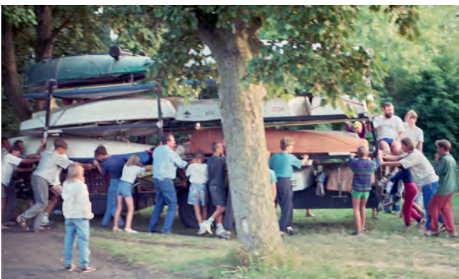
Ende Juli 1992 trafen die Prager zwei Tage verspätet in Barth ein. Die Deichsel ihres Trailers war auf der Autobahn gerissen und notdürftig repariert worden.

Am letzten Märzwochenende 1991 wurde in Barth ein neuer, den veränderten Bedingungen angepasster Vertrag unterzeichnet - nun mit dem wiedergegründeten BSV als Partner. In der Folge organisierten die Barther jährlich gemeinsame Trainingslager, luden Vertreter des tschechischen Clubs zu ihren Seglerbällen ein und reisten im Gegenzug zum winterlichen Skilaufen ins Isergebirge. Später schloss sich auch ein Rostocker Club dem Austausch an. Die Trainingslager wurden terminlich so geplant, dass die tschechischen Kinder im Anschluss an den jährlichen MV-Landesmeisterschaften der Kinder- und Jugendbootklassen teilnehmen konnten.