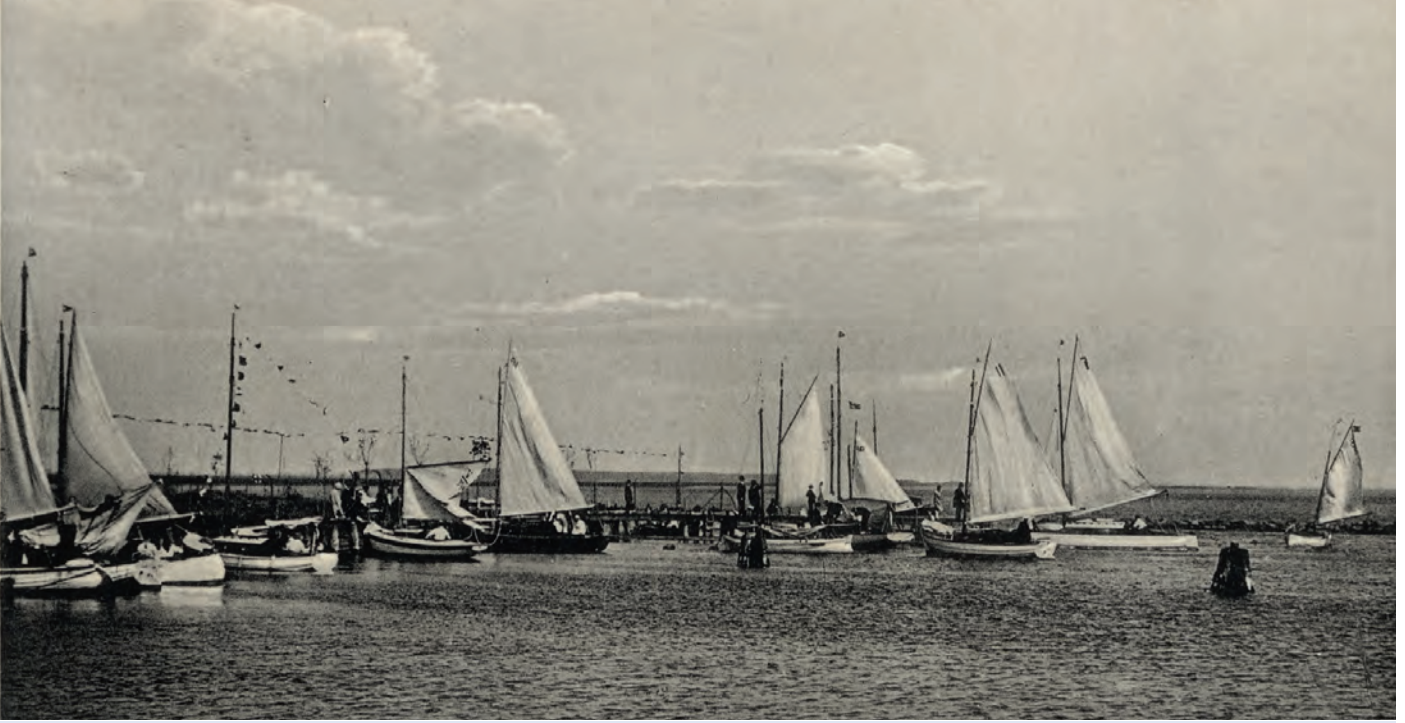
Die Vereinsboote auf einer Postkarte vor bzw. nach einer Wettfahrt oder bei einer gemeinsamen Ausfahrt.

provisorisch hergerichteten Bootschuppen. Die monatlichen Versammlungen fanden ohnehin in den Vereinslokalen „Seeblick“ oder „Central Café“ statt.