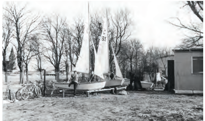
Im Frühjahr 1976 trafen die ersten GfK-Cadets ein .

ther zwecks Regattateilnahme sogar bis nach Polen.