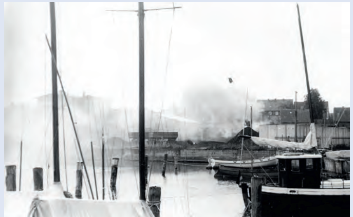
Ein jahrelanges Ärgernis war der Kohlenumschlag am Hafen. Brannte der Haufen wieder mal, wie Anfang der 1980er, bekamen die Boote besonders viel Dreck ab.