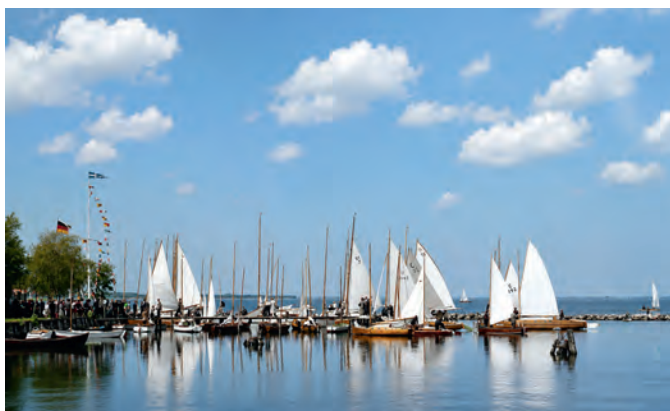
Auftakeln am Steg vor dem Auslaufen zur Wettfahrt.