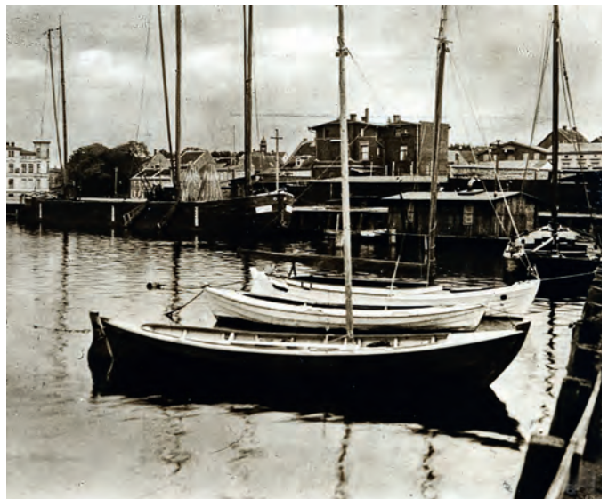
Postkartenausschnitt mit Booten an der Holzpier vor dem Baggerschuppen (heutige Bootshalle).

Aus dem für 1928 geplanten Bau eines Clubhauses wurde aufgrund der schwierigen wirtschaftlichen Situation nichts, stattdessen behielt man sich mit einem