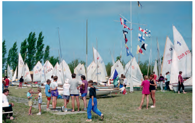
Das 3. Trainingslager mit dem YC Avia Prag 1992. Die Barther wurden dafür zum Skisport eingeladen.