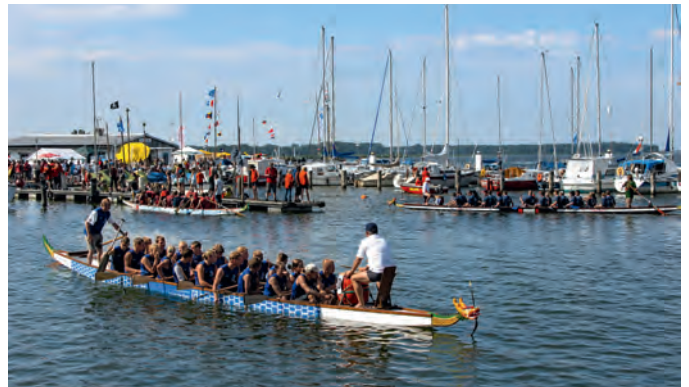
Drachenbootrennen mit Barther und auswärtigen Booten während der Segel- und Hafentage 2004.

Nach der Gründung des Vereins Barther Segel- und Hafentage im Oktober 1993, an der mehrere Mitglie-