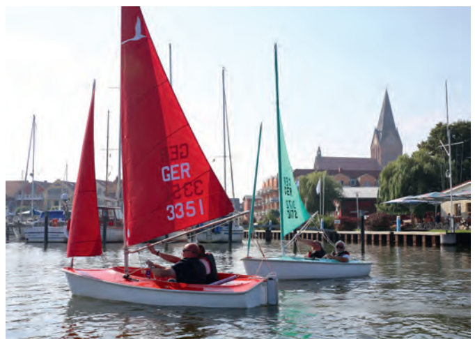
Die praktische Ausbildung der ersten Instrukteure aus dem BSV erfolgte im Sommer 2020.

Leider ist die praktische Umsetzung des Programms wegen der durch Baumängel bedingten Außerbetriebnahme des Jugend- und Freizeitzentrums erschwert. Statt die Inklusionssegler dort unterzubringen, müssen andere Quartiere im Stadtgebiet genutzt werden. Bisher (5/2026) konnten sich der Verein und die Stadt, in deren Bilanzvermögen das JFZ eingetragen ist, nicht über die Modalitäten der Schadensbehebung in Höhe einer sechsstelligen Summe einigen.