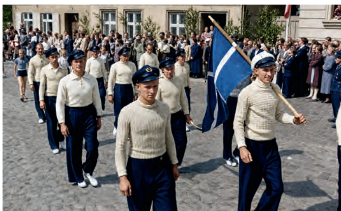
Jüngere Barther Segler im Festumzug am 10. Juli 1955.