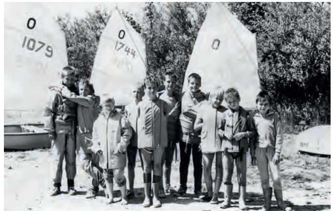
Das letzte Trainingslager als Jugendgruppe der Sektion Segeln fand im August 1989 auf dem eigenen Borgwallgelände statt. Es nahmen auch Kinder der SG Aufbau Ribnitz teil. Auf dem Foto sind fast alle Barther Nachwuchs-Optisegler versammelt.