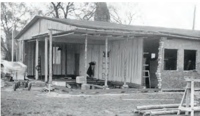
Beim Abriss der Außenwände im Oktober 1984 wurde das Dach abschnittsweise angehoben und abgestützt, um darunter anschließend die Mauern hochzuziehen.

Mit der Einweihung des neuen Clubhauses übernahm der im nahen Kulturmöbellager tätige Günter Lange den Ausschank. Die Nähe seiner Arbeitsstätte sicherte die pünktliche Öffnung der kleinen Kneipe an Werktagen um 16 Uhr, wenn im kurzen Takt die täglichen Stammgäste eintrafen. Spätestens um 19.30 Uhr schloss Günter Lange zu.