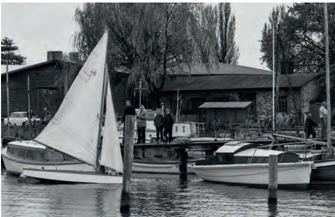
Klar zum Ansegeln nach Pruchten im Mai 1973.