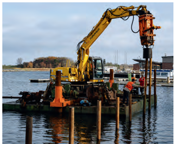
In heutiger Zeit werden Wasserbauunternehmen mit dem Rammen beauftragt, wie 2006 die Fa. Bossow.

zur Errichtung des geförderten neuen Schipperschuppens, nachdem die Segler den alten schon 2014 mit Unterstützung des THW abgerissen hatten.