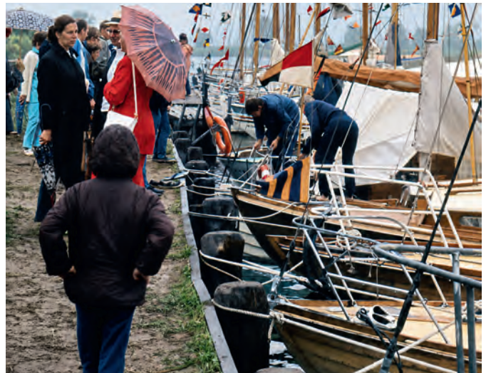
Gastboote 1972 im Westbecken vor dem Kohlenplatz.