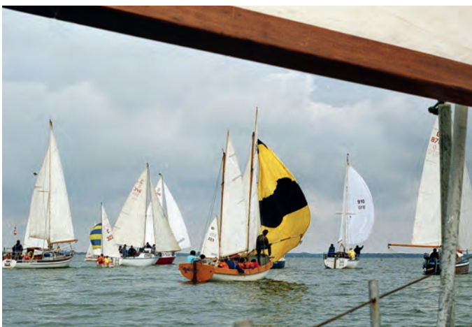
Absegeln 1991 auf dem Barther Boddens. Schon immer dabei waren die Segelkutter der früheren Seesportgruppe, die seit jenem Jahr dem BSV angehörte.

Waren Anfang der 1990er Jahre ausschließlich aus der DDR-Zeit stammende, kleinere Bootstypen und Eigenbauten am Start, kamen allmählich immer mehr größere und tiefergehende Yachten hinzu. Deshalb musste die Regattabahn aus dem flachen und beengten Revier des Barther Boddens in die weitläufigere und tiefere Grabow verlegt werden. Dort dient seit 2019 der modern ausgebaute Wasserwanderrastplatz Dabitz als Basis für die zweitägigen Veranstaltungen mit geselligen Abendrunden nach den Frühjahrs- und Herbstregatten, bei denen Gäste gern gesehen sind.