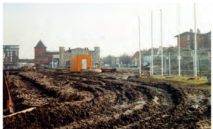
Kaum jemand wagte sich 1996 durch diesen Morast.

bootpaddler in zahllosen Eigenleistungsstunden das Clubhaus zur heutigen Gestalt um. Der Gastbetrieb musste nicht ruhen, weil die jeweiligen Baubereiche durch Platten abgeschottet wurden.