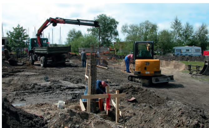
Im Frühjahr 2006 begannen die Gründungsarbeiten für das Jugend- und Freizeitzentrum.