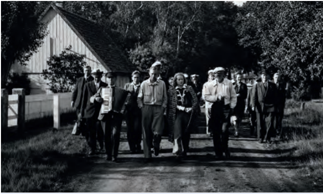
Auf dem Weg vom Anleger zur Gastwirtschaft Otholt.

Pfingst- oder Geschwaderfahrten auch in der Gastwirtschaft Rüting in Barhöft.