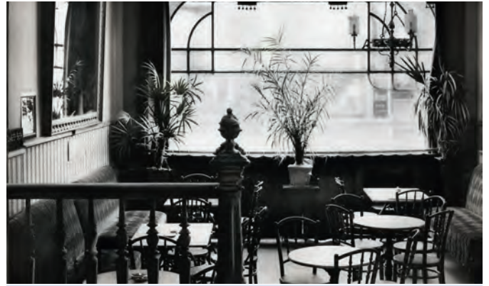
Das Vereinslokal „Central-Café“ auf einer Postkarte.

Die beginnenden 1930er Jahre könnten als erste Blütezeit des Vereins bezeichnet werden. Am 10. Mai 1932 taufte die Segelkameraden eine speziell für die Jugendabteilung angeschaffte 15 qm Halbbrennjolle auf den Namen „Gorch Fock“. Nach erfolgreichem Abschluss ihrer Ausbildung wurden die Jungmänner während einer Mitgliederversammlung feierlich in