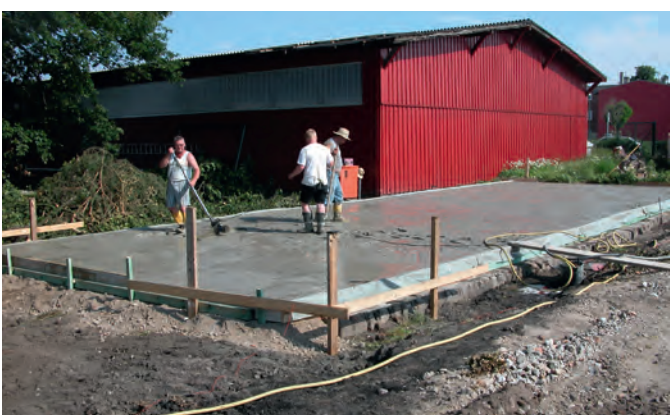
Die Platte für den Neubau ist fast fertig. Der Schipperschuppen darf noch sieben Jahre stehen bleiben.