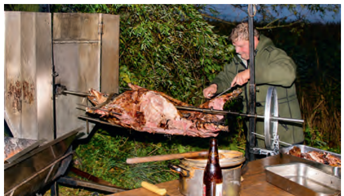
Nach dem Absegeln gibt es in Dabitz traditionell ein Wildschwein vom Spieß