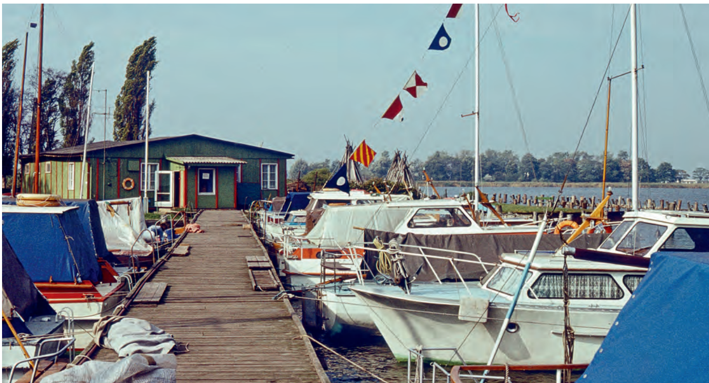
Der Boom beim Motorbootsbau ab Mitte der 1970er führte zur Unterrepräsentation von Segelbooten am Steg.

Die Motorbootsbauerei führte zu einer Disproportion zum Nachteil des Segleranteils im Verein, rechnet man die schon länger hier liegenden Motorboote hinzu. Irgendwann sah sich der Vorstand genötigt, einen Stopp für weitere Motorboote auszusprechen, der allerdings nicht bei Bootsübernahmen mit Liegeplatz galt. Erst in den 1990er Jahren löste sich das Ungleichgewicht langsam wieder auf.