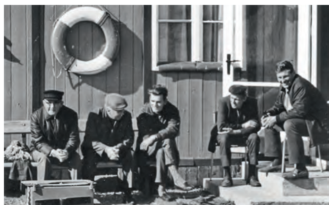
Schönwetterzene mit der „Lügenbank“ am Clubhaus.