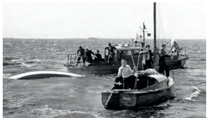
Die schwierige Bergung des gekenterten 15er JK.

Am Festumzug durch Barth nahmen am 10. Juli jüngere Vereinsmitglieder in einheitlicher Kleidung teil.