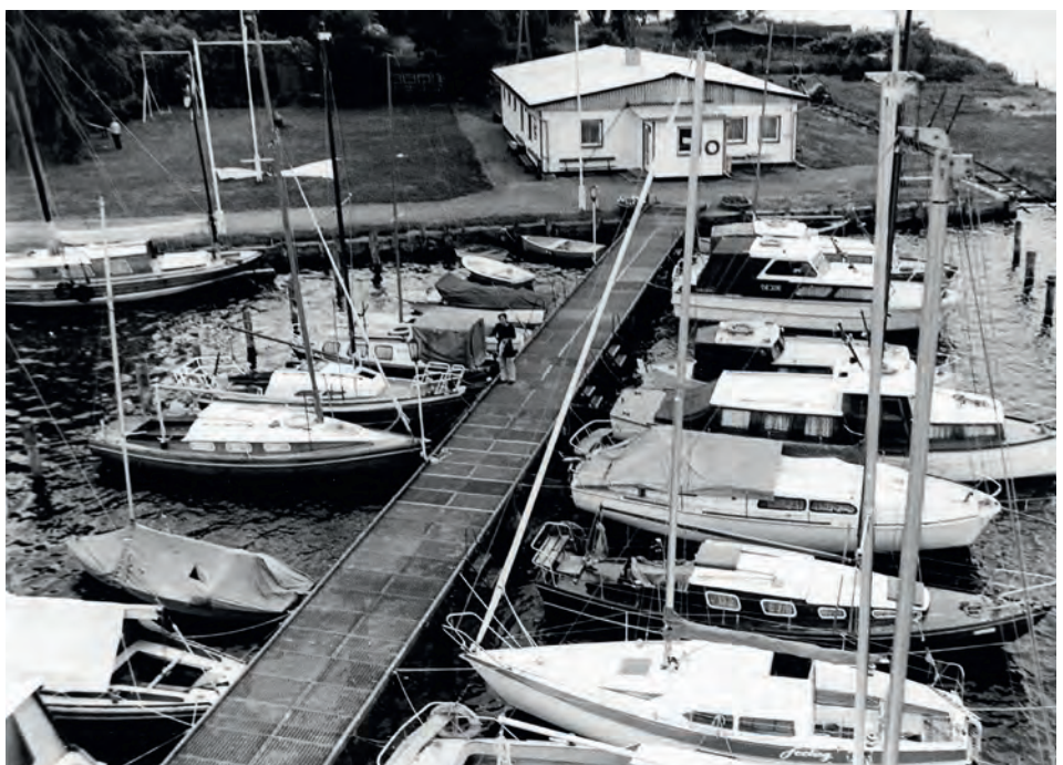
Ansicht des Steges der Sektion Segeln zum Ende der 1980er Jahre. Viele Holzboote waren inzwischen moderneren Eigenbauten aus Stahl gewichen.

Sonst prägten vor allem die Vorbereitung und Durchführung der drei Fahrtenseglertreffen Küste 1980, 1985 und 1988 sowie der Umbau des Clubhauses 1984/1985 das Vereinsleben dieses Jahrzehnts. Der Bootsbestand hatte sich durch viele Neubauten aus Stahl erheblich verjüngt und auch erste GfK-Yachten lagen nun am Steg.