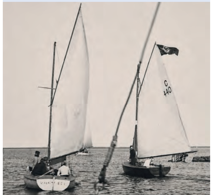
Unten: Regattajollen des BSV in der Molenausfahrt.

Ab 1933 wurden mit der Gleichschaltung aller Sportverbände im „Nationalsozialistischen Reichsbund für Leibesübungen“ (RfL) auch die beiden kleineren Seglerverbände dem Deutschen Segler-Verband (DSV) angegliedert.